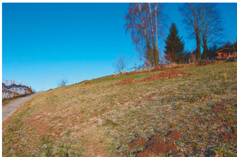
Auf dieser Parzelle, zwischen dem Wanderweg (links) und dem Schrebergarten (rechts), entsteht im Hinderbloch der neue Rebberg.